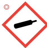
Nyomás alatt lévő gázok