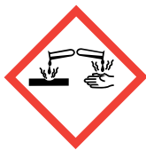
Fémekre maró hatású