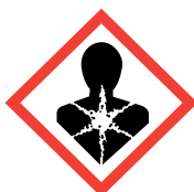
Komoly egészségügyi kockázat